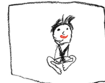
Ergebnisse eines Workshops anhand der Fotografie „Miriam“ aus der Ausstellung „Ihr glücklichen Augen“ von Rudi Weißenstein